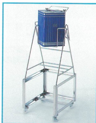
3 SK-03 角缶用ハイタイプキャスター付 ¥77,200 (181-220) ● 400 (320) × 460 (275) × 1085 (水平・720)