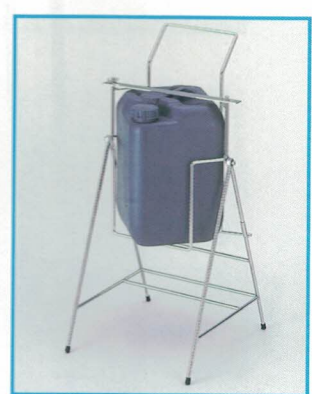
10 SK-13 角型ポリ缶用 ¥39,800 (181-D10) ● 425 × 440 × 855 ● 有効内寸：270 × 270 × 395 ● キャスター付・ハイタイプキャスター付も出来ます。