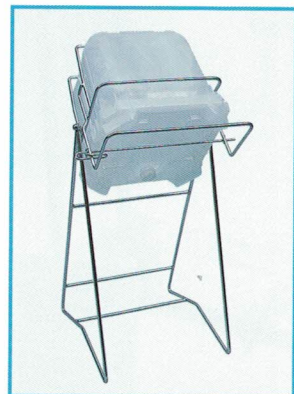
8 SKC-14 バッグインコンテナ用 ¥39,800 (C82-F10) ● 470 × 420 × 805 (水平・470) ● 有効内寸：305 × 325 × 295