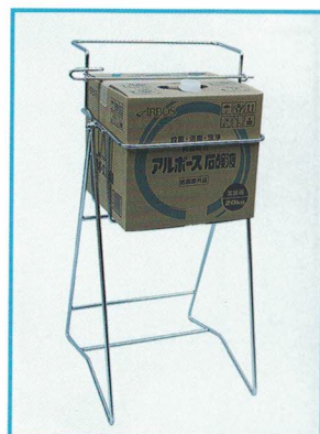
9 SKC-10 浅型段ボール用 ¥39,800 (C82-710) ● 470 × 420 × 805 (水平・525)

※キャスター付 ¥65,200 (181-320) ※ハイタイプキャスター付 ¥83,200 (181-330)