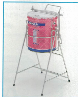
4 SK-05 丸缶用 ¥42,400 (181-310) ● 410 (内寸: φ305) × 440 × 740 ● 有効内寸：φ305 × 345 × 365

※キャスター付 ¥65,200 (181-320) ※ハイタイプキャスター付 ¥83,200 (181-330)