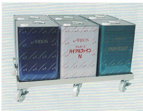
4 補強付 6缶用 ¥25,000 (A61-216) ●751(745)×513(500)×134(108) ●キャスター：φ75(ナイロン、自在車6ヶ、S3ヶ付)