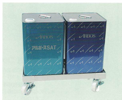
2 2缶用 ¥13,100 (A61-212) ●510(500)×253(245)×134(108)