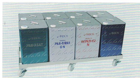
5 補強付 8缶用 ¥28,000 (A61-218) ●996(990)×513(500)×134(108) ●キャスター：φ75(ナイロン、自在車6ヶ、S3ヶ付)