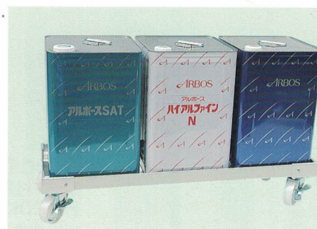
3 3缶用 ¥14,400 (A61-213) ●760(750)×253(245)×134(108) 補強付 4缶用 ¥19,000 (A61-214) ●506(500)×500(513)×134(108)